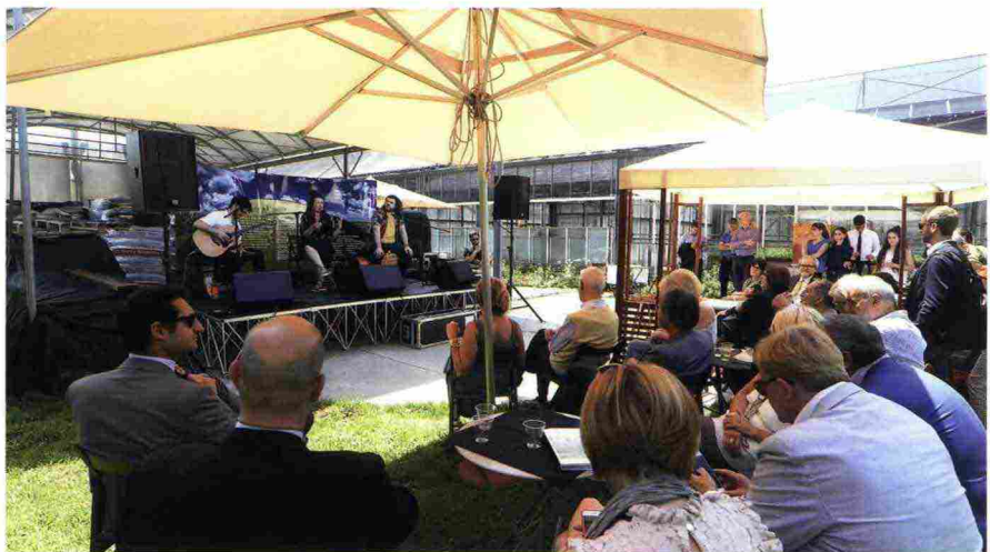
Lo 'sconcerto' de I Moderni