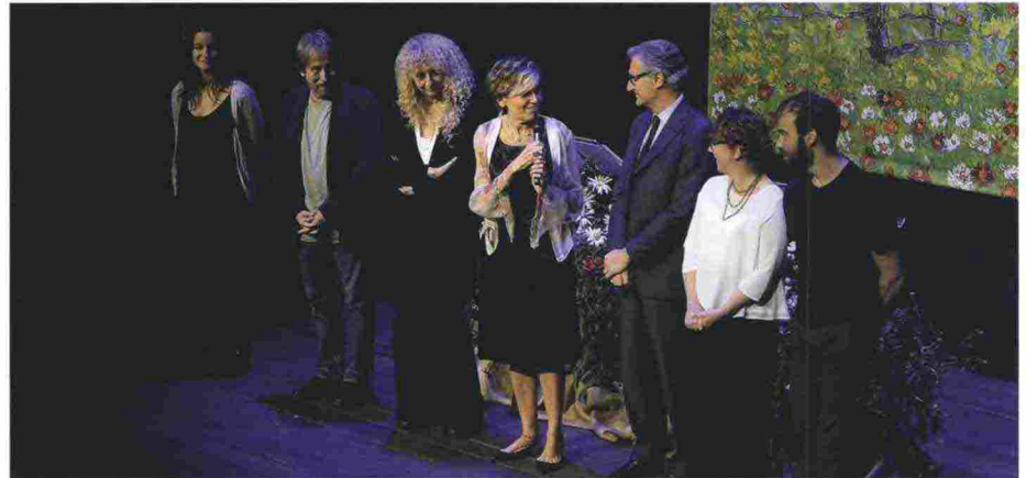
I protagonisti sul palco