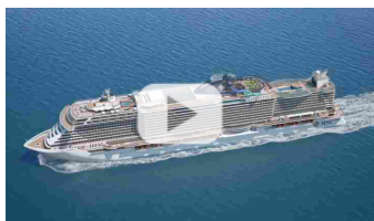
VIDEO Ecco le nuove nate nella flotta MSC

Piemonte, alla Xylella fastidiosa che ha sterminato gli ulivi nel Salento, passando per cinipide galligeno del castagno, sbarcato dalla Cina, che ha decimato drasticamente la produzione. E poi il Citrus Tristeza Virus ha attaccato gli agrumi in Sicilia, la batteriosi PSA le piante di Kiwi, mentre melo e pero in Emilia sono stati vittime della Erwinia amylovora . Senza dimenticare il punteruolo rosso che ha flagellato le palme italiane. Ma sono solo alcuni dei 63 patogeni particolarmente pericolosi individuati da Agrinnova , il Centro di Competenza per l'Innovazione nel Campo Agro-ambientale dell'Università di Torino, coordinatore del progetto PLANTFOODSEC sostenuto dalla Commissione Europea. Un danno alle coltivazioni Made in Italy che ammonta, secondo la Coldiretti, a circa un miliardo di euro mettendo a rischio di estinzione il patrimonio di prodotti tipici italiani che devono le proprie specifiche caratteristiche essenzialmente dalla combinazione di fattori naturali e umani.