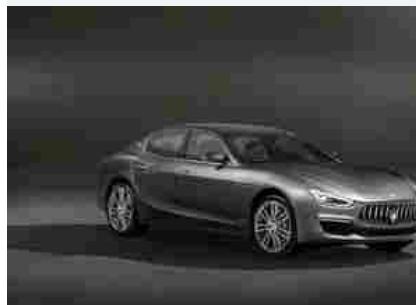
Maserati Ghibli GranLusso: sportiva, sofisticata e dinamica