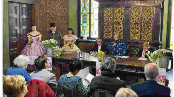
La presentazione della XX edizione di "Messer Tulipano" a Palazzo Cisterna a Torino, il 21 marzo. A sinistra un particolare tulipano ed il castello