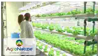
Serra ipertecnologica, parlano gli studenti