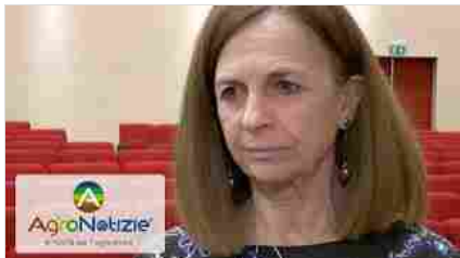
Aflattossine e biocontrollo con AFX1: abbattimento della contaminazione del 94%