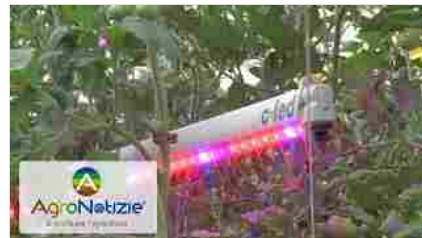
Lampade Led in serra: i vantaggi