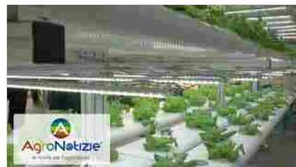
Una serra innovativa dentro un istituto superiore