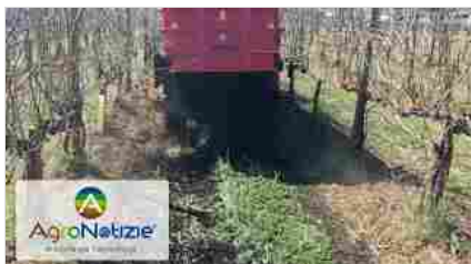
Vigneto, la concimazione organica a rateo variabile