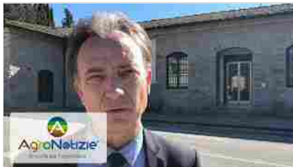
La sfida del climate change in vigneto