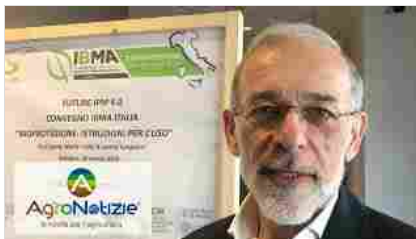
Bioprotezione: istruzioni per l'uso a Future Ipm 4.0