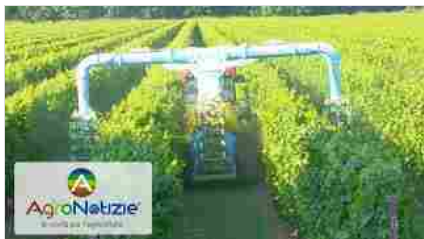
Bayer AgriCampus: la corretta distribuzione degli agrofarmaci