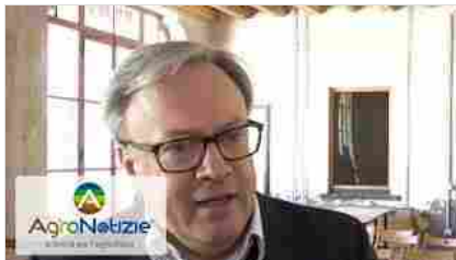
Pacciamatura, verso plastiche 100% da rinnovabili