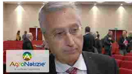
Micotossine: il progetto MyCoKey