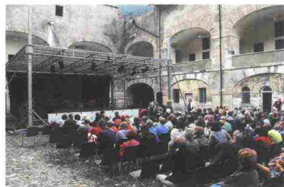
Tutti pronti per il 2° Drago a Tavola a Exilles