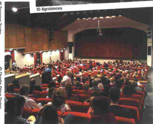
A Bardonecchia per i Sonics