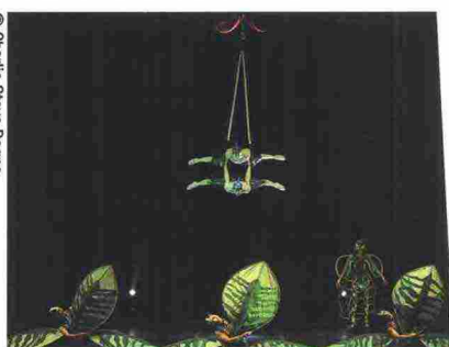
Sonics in 'Meraviglia'