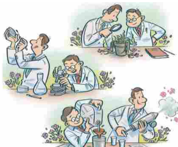
Illustrazioni di Gabriele Peddes tratte dal libro edito da Edagricole

C'è un Garibaldi che non è l'Eroe dei due Mondi che i libri di storia tramandano ormai da