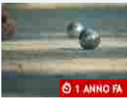
Altri sport Serie A di petanque, domenica 10 inizia il campionato