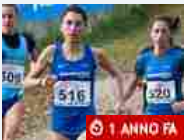
Atletica Cross, cinque piemontesi agli Europei