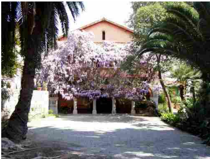
Biblioteca 'Clarence Bicknell'